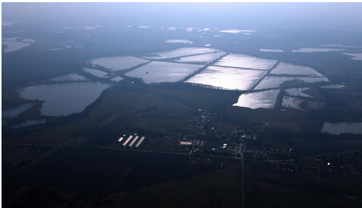
Pełna panorama na Stawy Wielikąt: Staw Lubomski, Syryński, Świekloch, widziana z kierunku północno-wschodniego, znad Lubomii