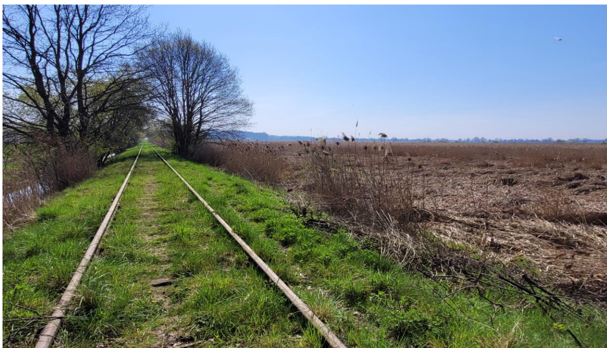
Nieczynna linia kolejowa na grobli przecinającej stawu, stanowiąca oś widokową