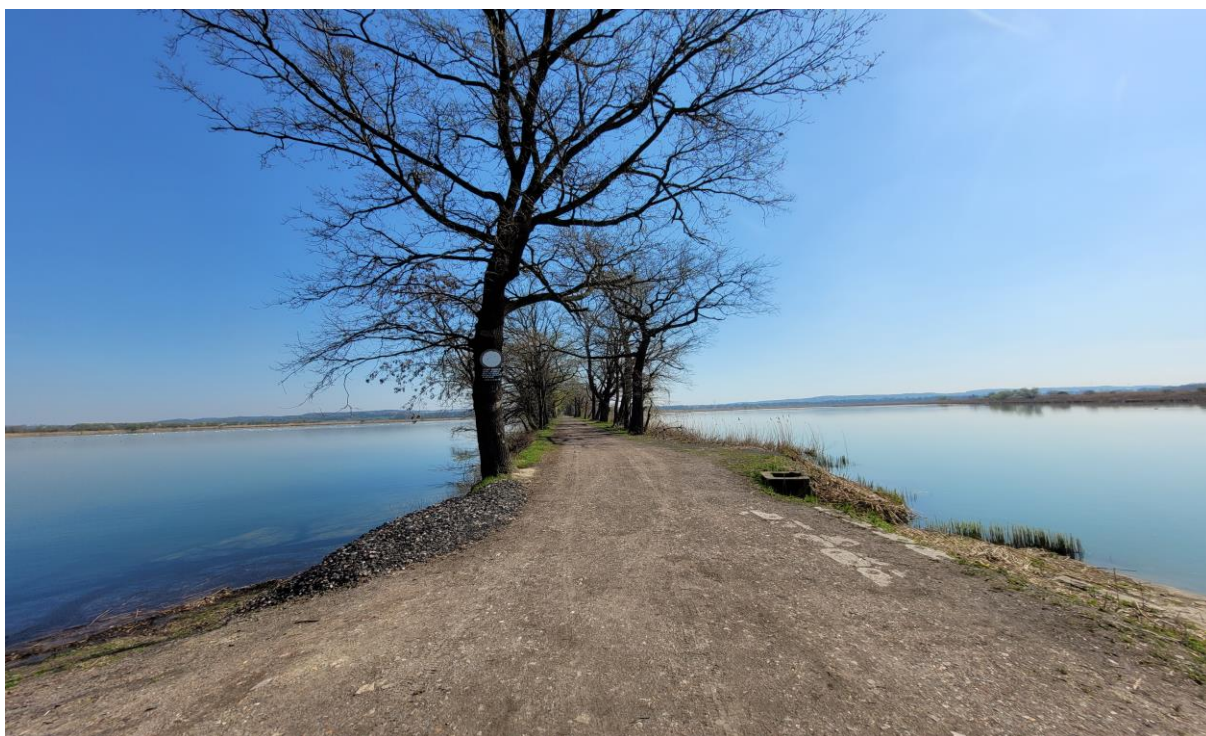
Porośnięta drzewami grobla pomiędzy Stawem Syryńskim i Lubomskim stanowiąca aleję spacerową, jedna z osi widokowych jednostki