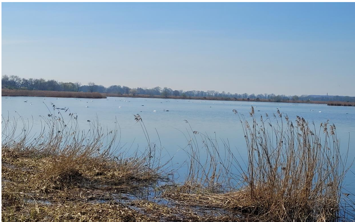
Kolonia łabędzia niemego na jednym ze stawów